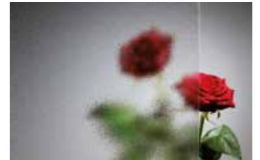
Ornament 504 weiß