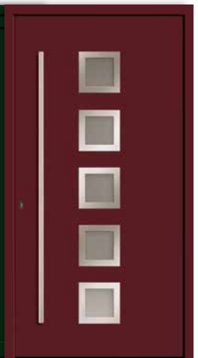
Modell: 7744-70 | E Rahmen: Edelstahloptik Füllung: Aufsatzfüllung Griff: 1600 mm Edelstahl-Stangengriff Farbe: Dunkelrot, ähnlich RAL 3011 Glas: Mastercarré weiß