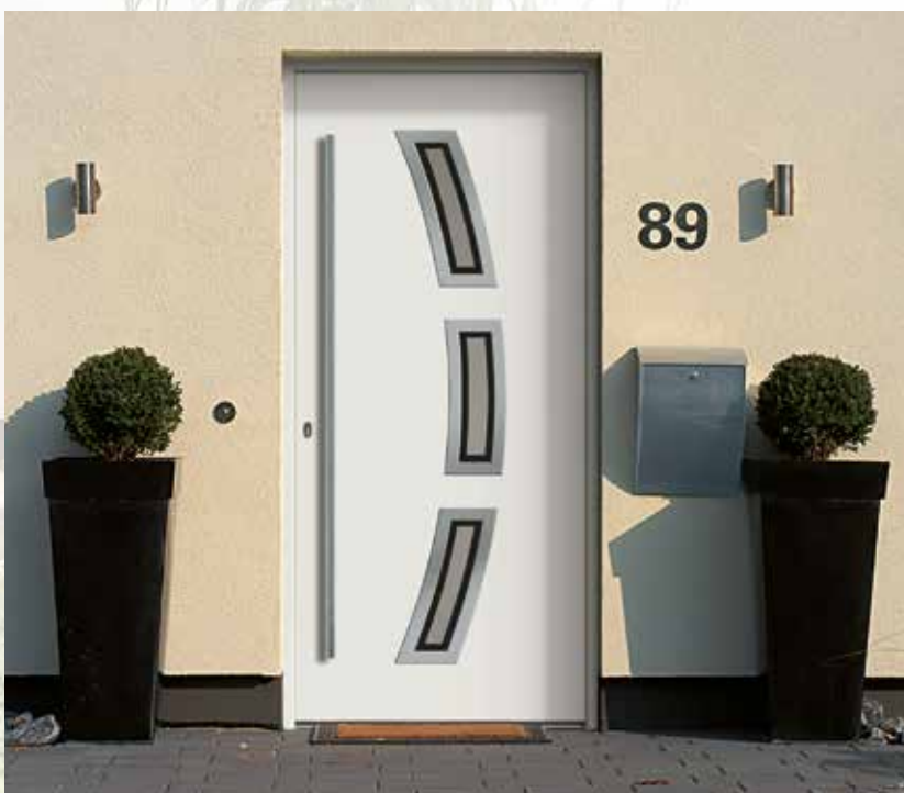
Modell: 7748-70 | P Rahmen: Edelstahloptik Füllung: Aufsatzfüllung Griff: 1600 mm Edelstahl-Stangengriff Farbe: Weiß Glas: mattiertes Glas mit klarem Rand