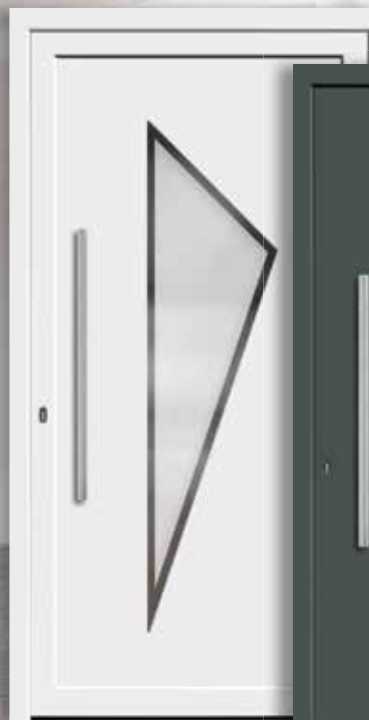
Modell: 7749-50 | A Rahmen: rahmenlos Füllung: Einsatzfüllung Griff: 800 mm Edelstahl-Stangengriff Farbe: Weiß Glas: mattiertes Glas mit klarem Rand