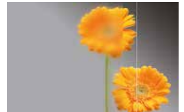
Mattiertes Glas mit klarem Rand