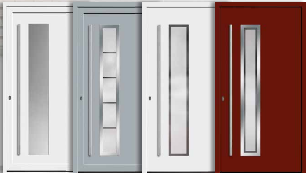
Modell: 7741-50 | L Modell: 7741-70 | M Modell: 7741-50 | N Modell: 7741-70 | O Rahmen: rahmenlos Rahmen: Edelstahloptik Rahmen: rahmenlos Rahmen: Edelstahloptik Füllung: Einsatzfüllung Füllung: Einsatzfüllung Füllung: Aufsatzfüllung Füllung: Aufsatzfüllung Griff: 1600 mm Edelstahl-Stangengriff Griff: 1600 mm Edelstahl-Stangengriff Griff: 1600 mm Edelstahl-Stangengriff Griff: 1600 mm Edelstahl-Stangengriff Farbe: Weiß Farbe: Grau, ähnl. RAL 7001 Farbe: Weiß Farbe: Dunkelrot, ähnlich RAL 3011 Glas: Satinato Glas: mattiertes Glas mit klaren Linien Glas: mattiertes Glas mit klarem Rand Glas: mattiertes Glas mit klarem Rand