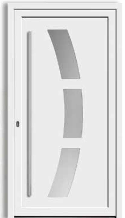
Modell: 7748-50 | Q Rahmen: rahmenlos Füllung: Einsatzfüllung Griff: 1600 mm Edelstahl-Stangengriff Farbe: Weiß Glas: Satinato weiß