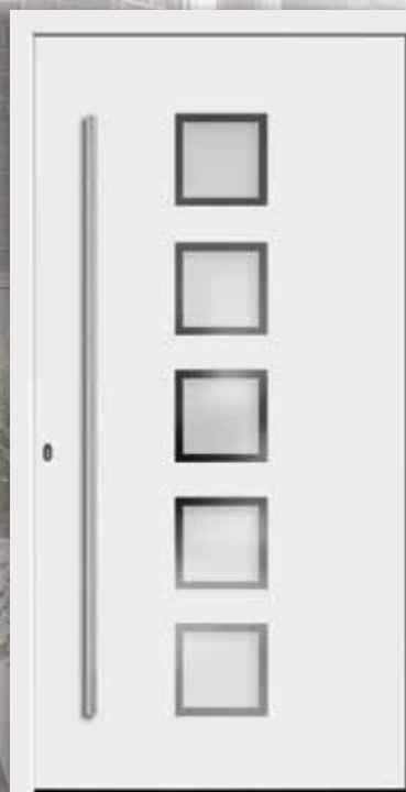
Modell: 7744-50 | C Rahmen: rahmenlos Füllung: Aufsatzfüllung Griff: 1600 mm Edelstahl-Stangengriff Farbe: Weiß Glas: mattiertes Glas mit klarem Rand

Türen sind mehr als nur Eingänge. Sie laden ein und begrüßen. Sie gestalten den ersten Eindruck. Gleichzeitig sollen sie vor Hitze und Kälte, Lärm und Einbruch schützen. Wie ein Fenster besteht auch eine Tür aus einem Rahmen und einem Flügel, in dem die Türfüllung verbaut ist. Wählen Sie neben dem passenden Profiltyp eine Füllung aus über 250 Füllungsvarianten. Durch hochwertige Beschläge ergänzen Sie das individuelle Plus an Sicherheit und gestalten so die Visitenkarte Ihres Hauses.