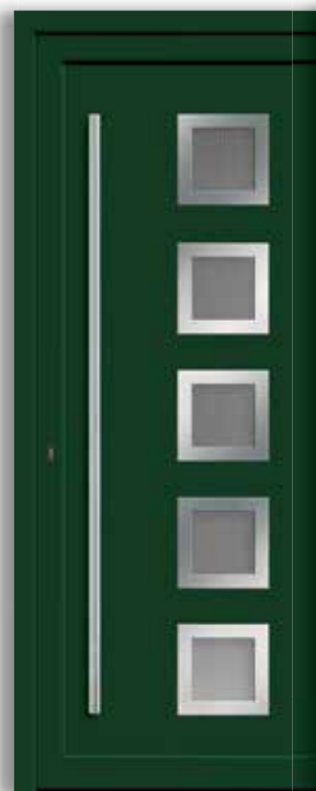
Modell: 7744-70 | D Rahmen: Edelstahloptik Füllung: Einsatzfüllung Griff: 1600 mm Edelstahl-Stangengriff Farbe: Dunkelgrün, ähnlich RAL 6009 Glas: Mastercarré weiß