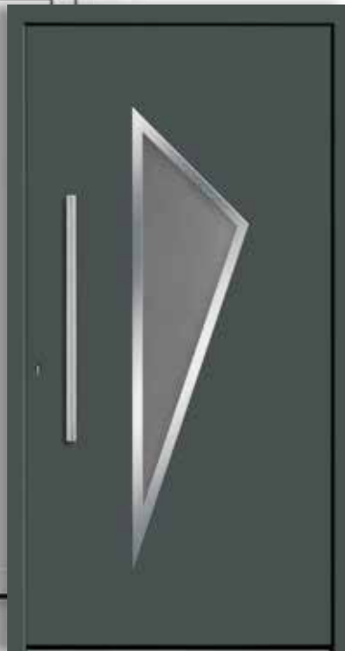
Modell: 7749-70 | B Rahmen: Edelstahloptik Füllung: Aufsatzfüllung Griff: 800 mm Edelstahl-Stangengriff Farbe: Basaltgrau, ähnlich RAL 7012 Glas: Mastercarré weiß